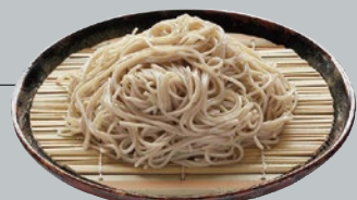
のど越し派の方は“更科”がおすすめ!

蕎麦の殻部分を取り除き、内側の実の部分を用いています。そのため色は白く繊細で、上品なおそばとなります。シャッキリとした食感とほのかな甘みが特徴です。