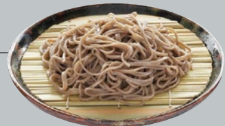
田舎風がお好きな方は“藪”がおすすめ!

蕎麦の殻部分も粉に挽きこんでいます。そのため色が黒く、素材で野趣あふれるおそばとなります。香りとコシの強さが特徴です。